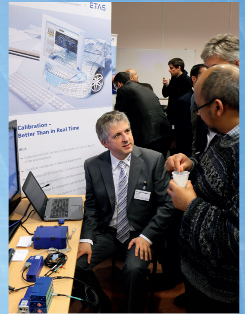
ETAS Frankreich war Gastgeber des Kundenevents Advanced Calibration in Paris, Frankreich. Im Fokus: Innovative Applikationslösungen von ETAS.