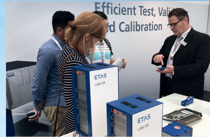
ETAS UK nahm am Conex Low Carbon Vehicle Event in Millbrook, Großbritannien, teil. Im Fokus: Motorsteuergeräte effizient testen und applizieren.