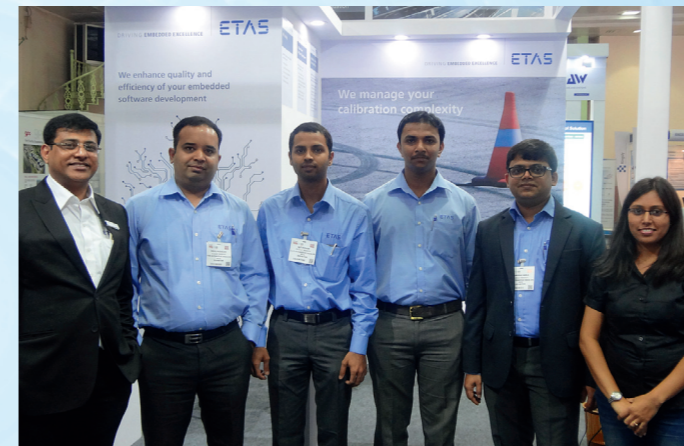
ETAS Indien war auf der Automotive Testing Expo in Chennai, Indien, vertreten. Im Fokus: Effizientes Testen, Komplexitätsbeherrschung in der Applikation.