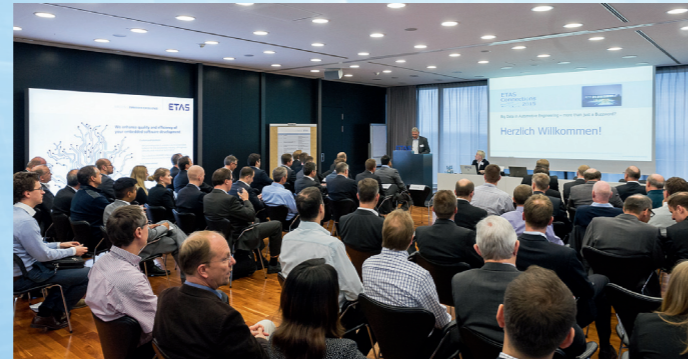
ETAS hat zum Kundenevent ETAS Connections in Stuttgart eingeladen. Im Fokus: Big Data im Automotive Engineering.