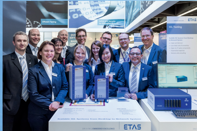
ETAS und ESCRYPT zeigten ihr Portfolio auf der embedded world in Nürnberg. Im Fokus: Safety und Security, effizientes Testen, Eclipse-basierte Software-Entwicklung.