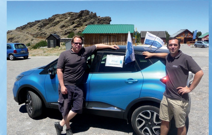
Das ETAS Support Team unterstützte Applikateure bei ihren Testfahrten in Granada, Spanien.