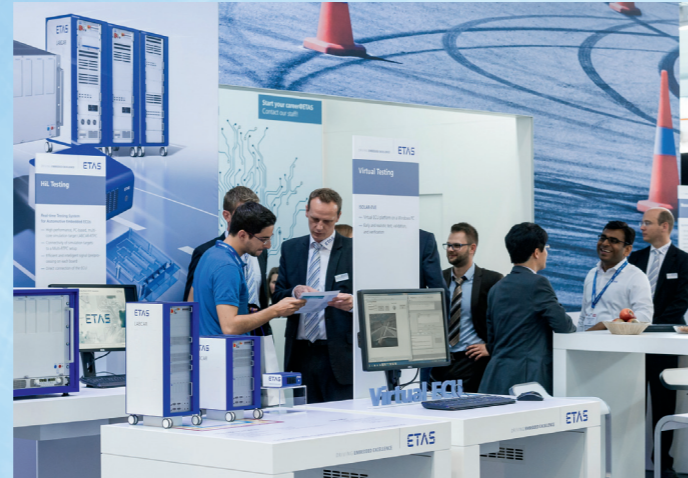
ETAS präsentierte Lösungen auf der Automotive Testing Expo in Stuttgart. Im Fokus: Effizientes Testen, Komplexitätsbeherrschung in der Applikation.