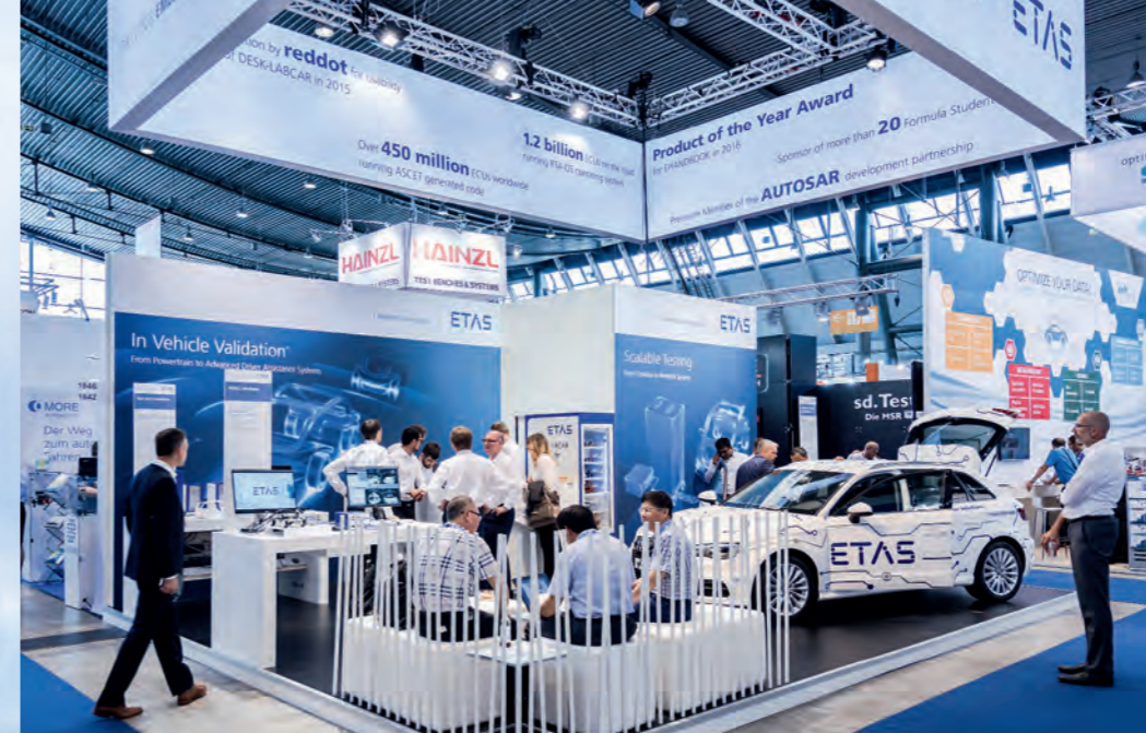
ETAS-Stand auf der Automotive Testing Expo 2017 in Stuttgart mit den Schwerpunktthemen Skalierbare Testlösungen – Von Desktop- bis zu Netzwerksystemen, Validierung von Fahrzeugen und Messlösungen.