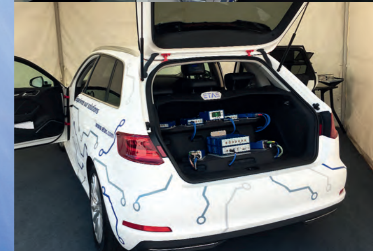
ETAS UK nahm zusammen mit Bosch am Cenex Low Carbon Vehicle Event in Millbrook, Großbritannien, teil. Ein Highlight war auch hier das ETAS Demo Car, ausgestattet mit INCA-TOUCH und ETAS-Hardware.