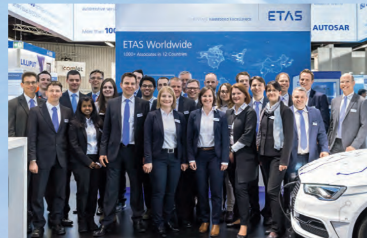
ETAS und ESCRYPT zeigten auf der embedded world in Nürnberg Lösungen zur Software-Entwicklung sowie Safety und Security. Ein Highlight war das ETAS Demo Car, ausgestattet mit INCA-TOUCH und ETAS-Hardware.