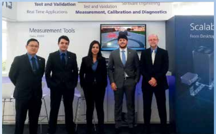
이타스 브라질은 상파울루에서 '데스크탑에서부터 네트워크 시스템과 측정 툴에 이르는 확장 가능한 테스트'라는 주제로 '자동차 공학 국제 심포지엄(SIMEA)'에 참가했습니다.