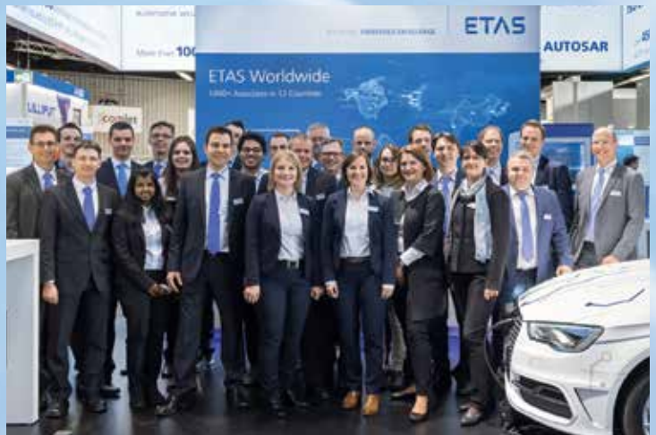
이타스와 에스크립트는 독일 뉘른베르크에서 진행된 '임베디드 월드(Embedded World)'에서 소프트웨어 개발, 안전 및 보안 솔루션을 선보였습니다. 특히 INCA-TOUCH와 이타스 하드웨어가 장착된 이타스 데모 차량이 주목을 끌었습니다.