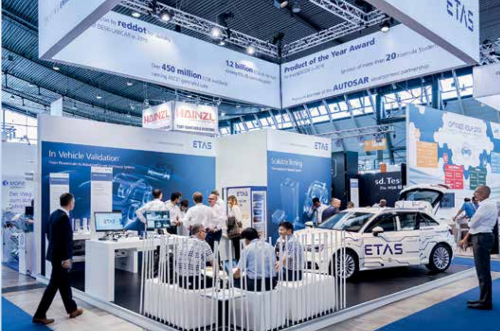
독일 슈투트가르트에서 열린 ‘오토모티브 테스트링 엑스포(Automotive Testing Expo) 2017’에서 이타스 부스는 데스크톱, 네트워크 시스템, 측정 및 검증과 같은 확장 가능한 테스트를 고객들에게 소개하는데 중점을 두었습니다.