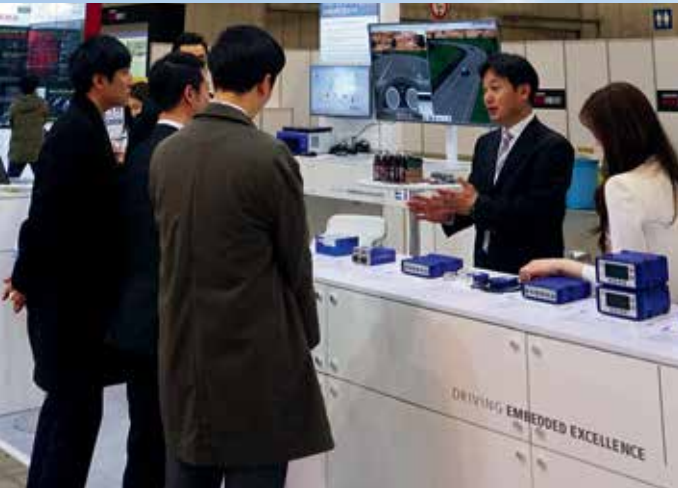
이타스 코리아는 일산 킨텍스에서 열린 '오토모티브 테스트팅 엑스포 2017'에서 'XiL (X-in-the-Loop), 모든 솔루션을 측정하다'라는 주제로 다양한 솔루션을 선보였습니다.