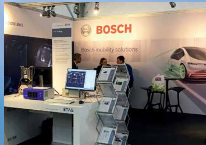
이타스 영국은 영국 밀브룩(Millbrook)에서 열린 ‘Cenex 저탄소 자동차 행사’에 보쉬와 함께 참가했습니다. 이 때 INCA-TOUCH와 이타스 하드웨어가 장착된 이타스 데모 차량이 다시 한번 주목받았습니다.